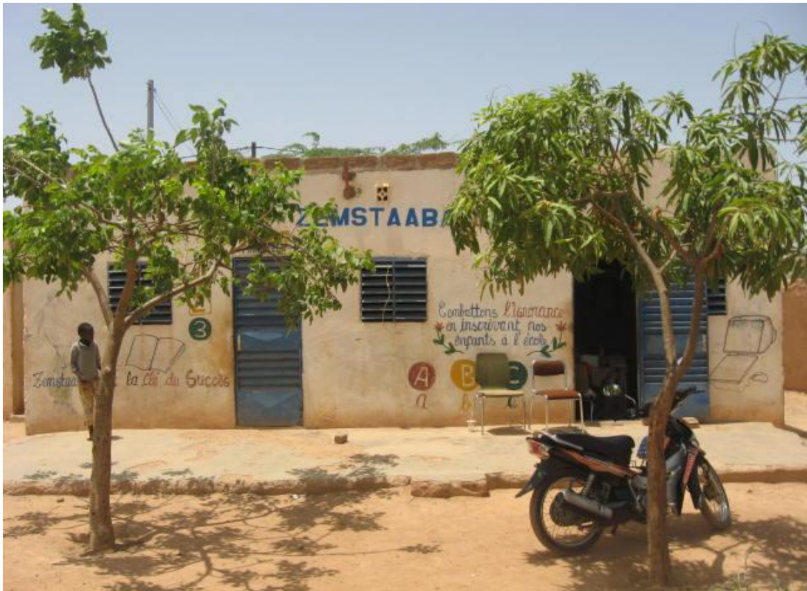
Administration de l'école