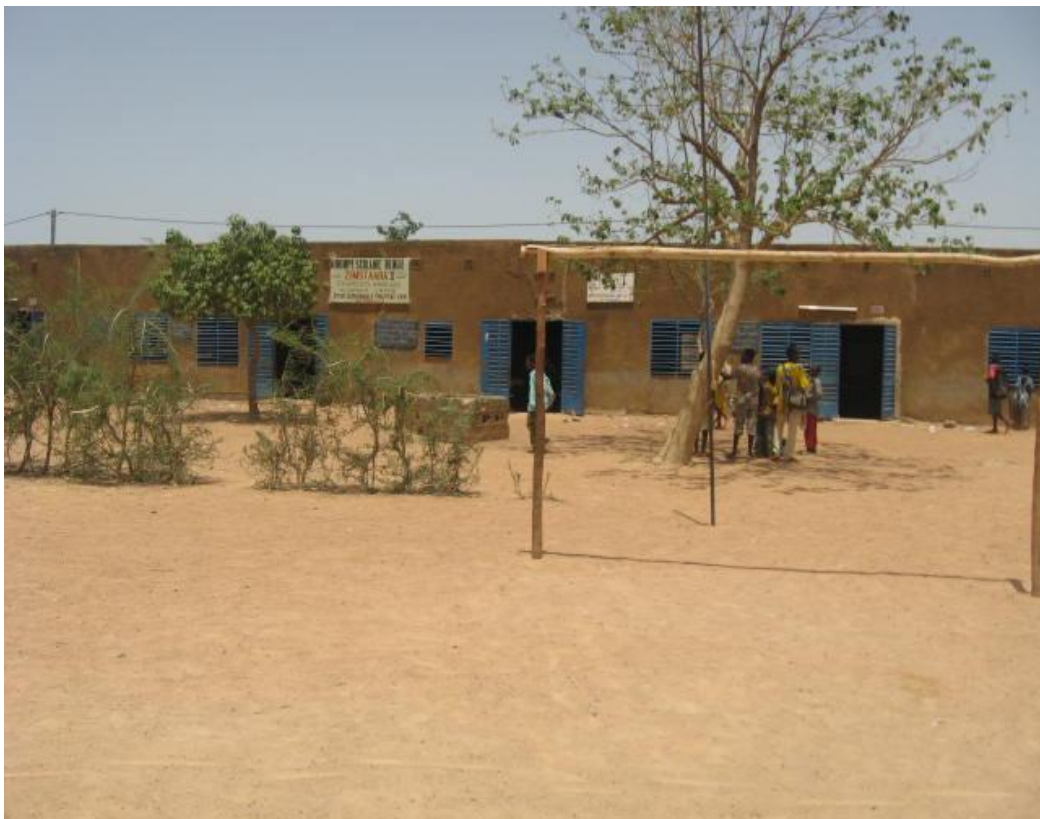
l'école maternelle, la cour